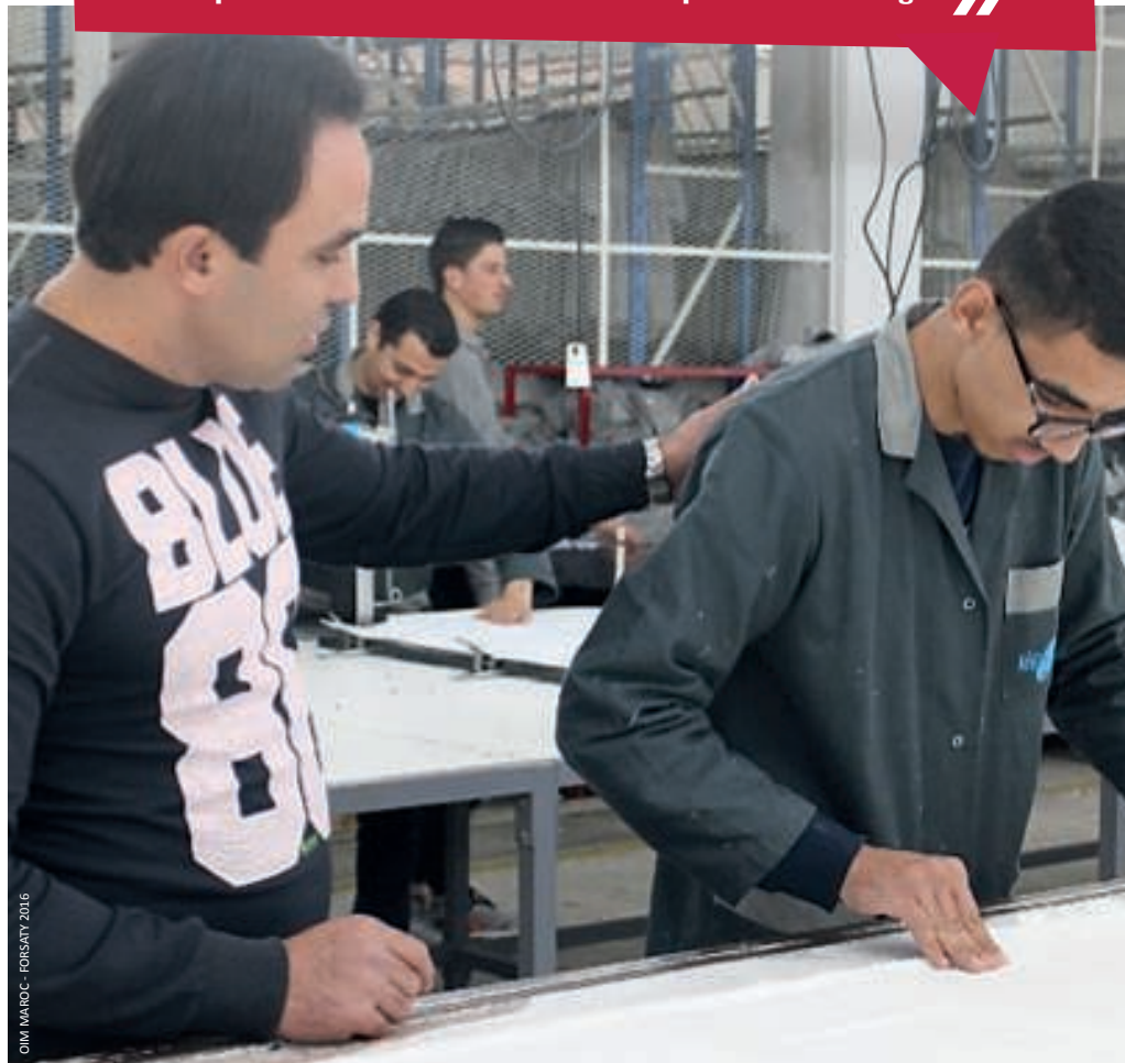
OIM MAROC - FORSATY 2016

« Grâce à FORSATY j'ai eu l'opportunité de présenter un Festival dans mon quartier et j'étais FORMIDABLE. Ma mère était fière de moi, m'a applaudit de tout son cœur et disait à tout le monde dans la salle que j'étais son fils. À partir de cet instant ma vie a complètement changé. »