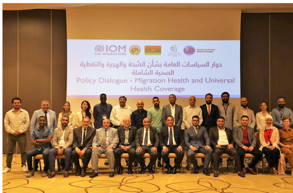
Les représentant.e.s du Ministère de la Santé, de la Direction de la lutte contre la migration illégale (DLMI), du CNRSS, du Ministère des Affaires étrangères de l'Ambassade de Finlande en Tunisie, des agences des Nations unies et des partenaires internationaux réuni.e.s à Tunis.

Dans le cadre de la réforme actuelle du système de santé menée par le Centre national libyen pour les réformes du système de santé (CNRSS), l'OIM Libye a organisé un dialogue national afin d'intégrer les considérations migratoires dans la nouvelle stratégie et développer des politiques de santé incluant les migrant.e.s. Les experts de la santé ont délibéré sur les politiques et stratégies de santé, le financement des services de santé, les services de santé essentiels pour les migrant.e.s, ainsi que les données et les éléments probants relatifs à la santé des migrant.e.s. Plus de 20 représentant.e.s du Ministère de la Santé, de la Direction de la lutte contre la migration illégale