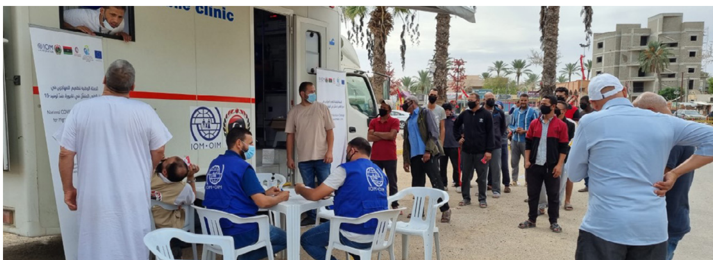
L'équipe de l'unité mobile effectuant des consultations médicales dans l'Ouest de la Libye

⇒ Les migrant.e.s ont bénéficié d'une assistance médicale fournie par une unité mobile dans l'ouest de la Libye d'avril à juin 2022.