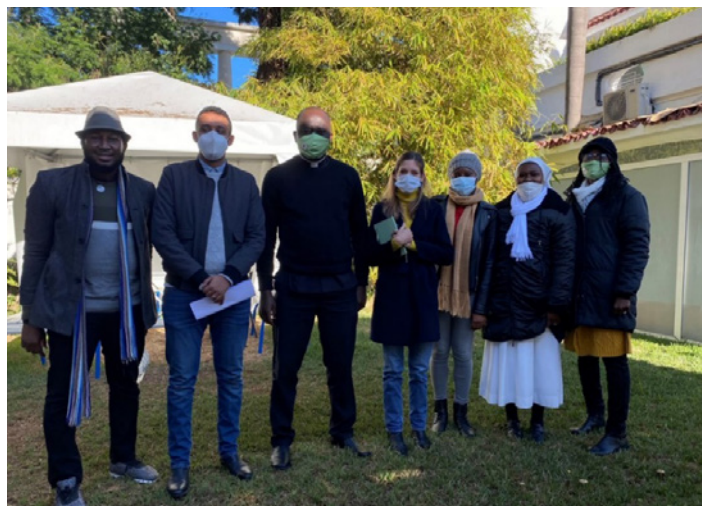
Groupes de parole constitué des leaders communautaires et des représentant.e.s de la population migrante de Caritas Casablanca au bureau de l'OIM Maroc.

Les migrant.e.s ont accès à la vaccination contre le COVID-19 – depuis octobre 2021 pour les personnes en situation irrégulière – l'enquête a démontré que 52% des personnes interrogées n'ont pas eu accès au vaccin. Parmi celles et ceux n'ayant pas eu accès, 70% n'ont pas souhaité se faire vacciner contre 30% qui le souhaitent mais qui n'ont pas pu. Parmi celles et ceux qui ont refusé le vaccin, 36%