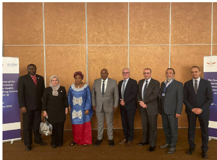
Le Ministre de la Santé de l'Égypte en compagnie des hauts fonctionnaires, des spécialistes des États membres de l'Union Africaine et des représentants de l'OIM Égypte au Caire le 4 et 5 juin.

Ce CTS a été l'occasion d'échanger autour de l'abus de drogues et aux troubles liés à la consommation de substances dans le contexte des systèmes de soins de santé généraux ainsi que de discuter d'éventuelles politiques sanitaires et sociales favorisant l'accès aux soins de santé pour les personnes toxicomanes, y compris la population migrante.