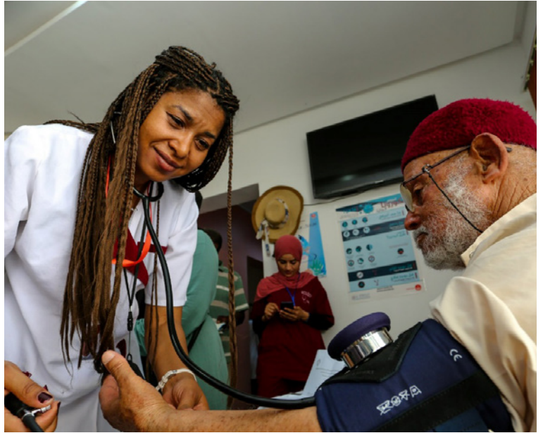
Le personnel médical de l'Association pour la recherche et la formation scientifique effectuant une prise de tension à un bénéficiaire.

En partenariat avec la Direction régionale de la santé de Médenine et l'Office national de la famille et de la population de Médenine, 1 479 migrant.e.s et membres des communautés d'accueil (978 femmes et 501 hommes) ont bénéficié de consultations médicales pendant deux jours à Médenine et Sidi Makhlouf. Le personnel médical et paramédical de l'Association pour la recherche et la formation scientifique des professionnel/les de la santé a dispensé des soins, y compris psychologiques, et a sensibilisé les migrant.e.s et les communautés d'accueil aux services de santé disponibles dans la région.