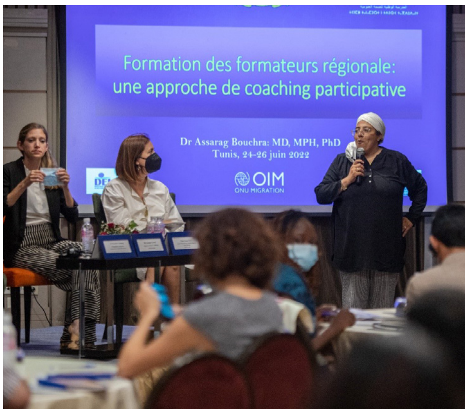
Pr Bouchra Assarag de l'École Nationale de la Santé Publique du Maroc pendant la clôture de la formation des formateurs à Tunis le 24 juin.

Cet exercice de clôture, organisé en présentiel, intervient à la suite d'une formation en ligne qui s'était déroulée au cours des mois de juin et juillet 2022 auprès d'un groupe de 37 formateurs/trices de la région MENA. Cette rencontre a eu pour objectif de conduire des séances de perfectionnement sur les modules ainsi que soutenir les participant.e.s dans l'adaptation du manuel de formation développé par l'École Nationale de Santé Publique du Maroc au contexte de chacun des pays ciblés par le projet. Les thèmes abordés dans les modules comprennent des concepts clés sur la santé et la migration, l'interculturalité, la santé mentale, la santé sexuelle et reproductive, les maladies transmissibles et non transmissibles. À l'issue de la rencontre, les formateurs/trices étaient prêt.e.s à mener des