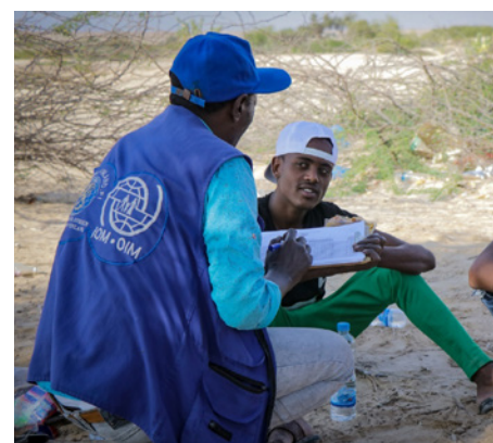
Le staff de l'OIM Yémen en compagnie de migrants pendant les consultations effectuées par l'équipe médicale mobile.

Depuis 2018, l'équipe médicale mobile de l'OIM à Shabwah a fourni une assistance à près de 26 600 migrant.e.s.