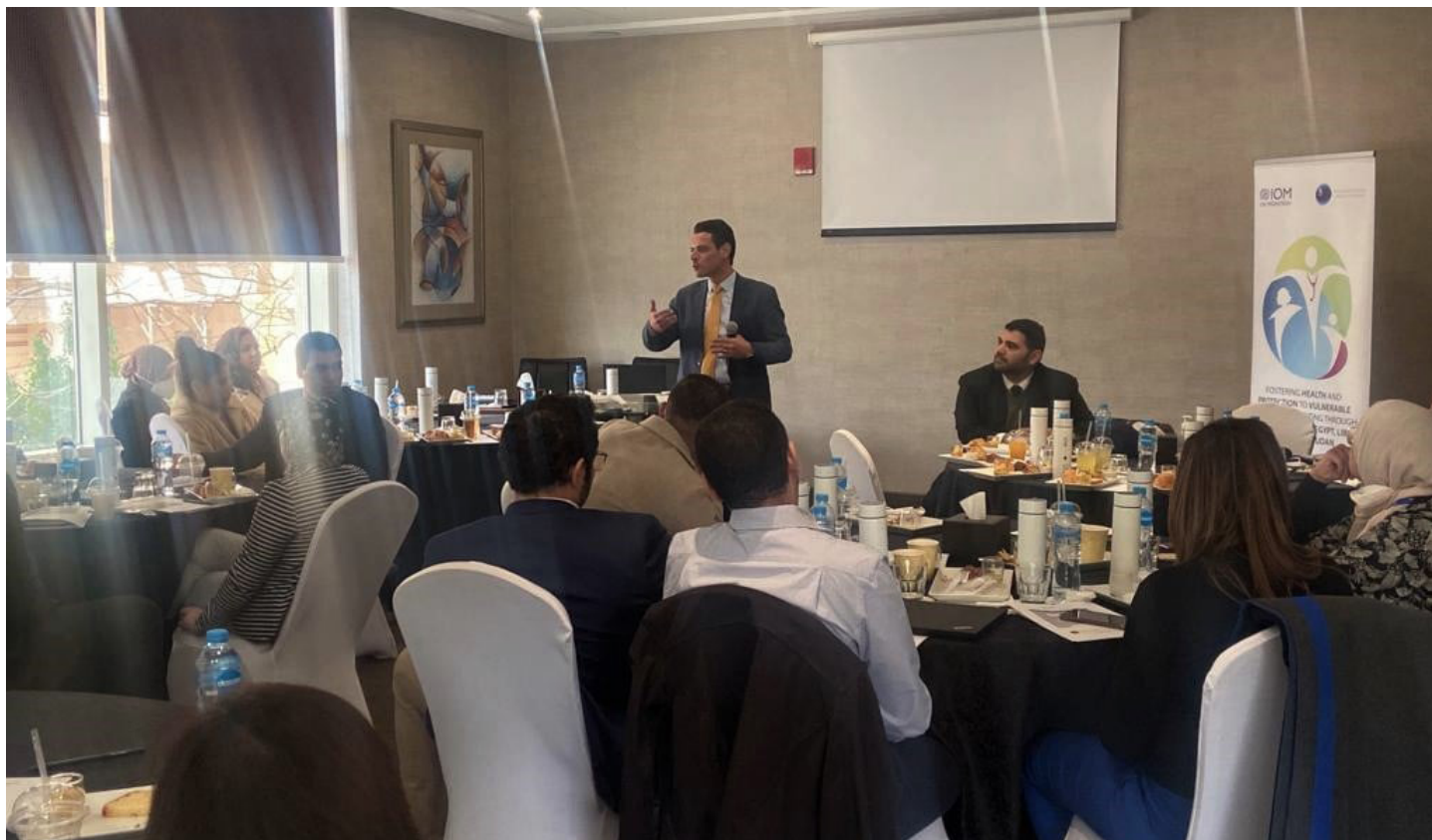
Table ronde autour de l'accès de la population migrante à la vaccination contre le COVID-19 au Caire le 22 mars 2022.

La table ronde a été l'occasion d'identifier les obstacles liés à l'accès aux services de santé pour les populations migrantes, en particulier la vaccination contre le COVID-19 et d'élaborer des pistes pour améliorer l'accès à ces services. Cette rencontre a réuni des représentants du Ministère de la Santé et de la Population, d'Agences des Nations unies, d'organisations de la société civile et des leaders communautaires.