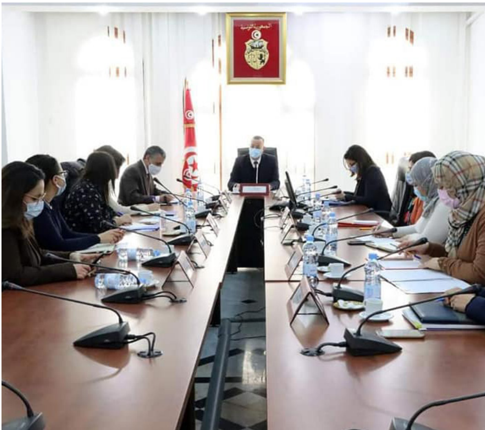
Rencontre entre le ministre de la Santé de la Tunisie et le chef de l'OIM Tunisie du système de santé inclusif de la population migrante.